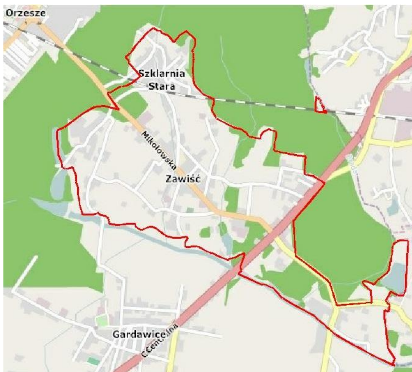
Rys 1. Mapa obszaru objętego projektem planu miejscowego.